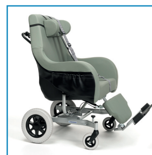
Coraille XXL con 4 ruedas (2 x 250 mm y 2 x 125 mm)