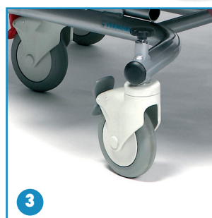
Ruedas con freno (125 x 32 mm) modelo Altitude XXL