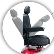
ASIENTO PIVOTANTE Y AJUSTABLE Para mayor confort, equipado con un reposacabezas extraíble