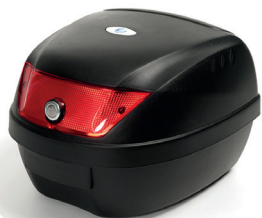
SW03 Caja de herramientas