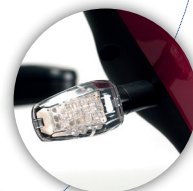
SISTEMA DE LUCES LED Luces LED frontales y traseras con intermitentes