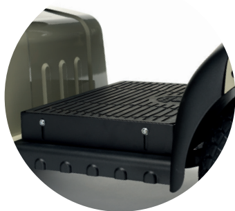
SW84 Reposapiés elevado