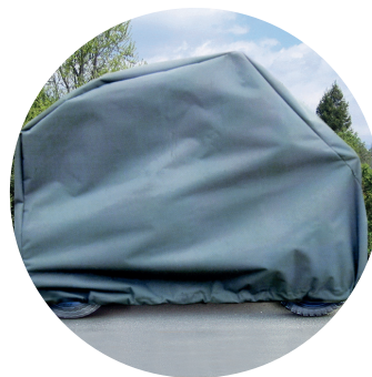
SH08 Funda de scooter