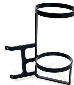
B83 Porta bombona de oxígeno cilíndrica