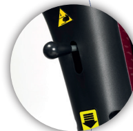
COLUMNA DE DIRECCIÓN Ajustable para una mejor conducción