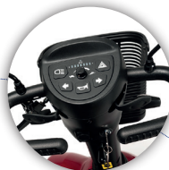
DISPLAY Fácil de usar